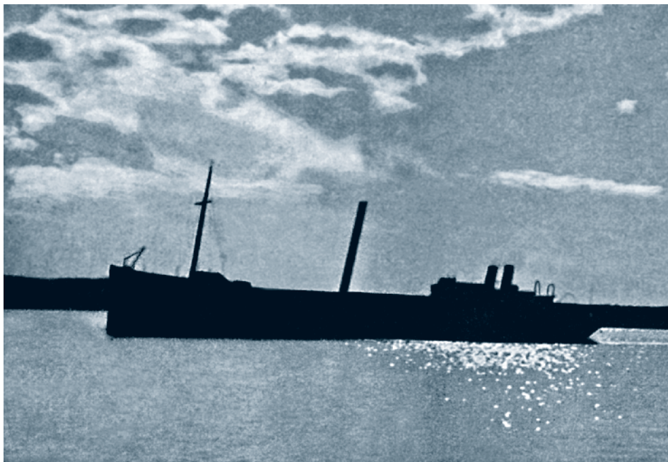
Saulėlydis Kuršių mariose su uosto siurbliu „Jūra“. Šiame laive prie jūros „pratinsi“ pirmieji mūsų jūreiviai